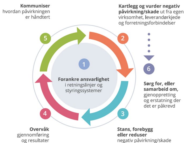
Figur: OECDs kontaktpunkt

Aktsomhetsvurderinger utføres i tråd med OECDs retningslinjer for flernasjonale selskaper, som innebærer en 6-stepsprosess.